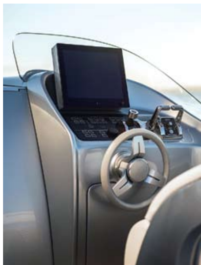
Справа внизу Серебристый цвет корпуса лучше всего подходит лодкам с футуристическим дизайном.

Arrows Marine . Яхта Arrow 460 Granturismo имеет весьма необычный экстерьер и интерьер. На борту 14-метровой яхты размещаются 10 пассажиров, скоростной максимум лодки – 40 узлов. То, что нужно, любителям стремительно перемещаться из марины в марину. Примечательно, что разработчики подумали не только о том, чтобы лодка внешне идеально вписалась в стилистику Mercedes-Benz. Любителям даже самого экстремального моторного яхтинга тоже иногда хочется отдохнуть от рева моторов, палящего солнца и ветра в лицо. Именно для этих целей у Arrow 460 Granturismo есть салон с причудливо изогнутой кушеткой, которая в носу