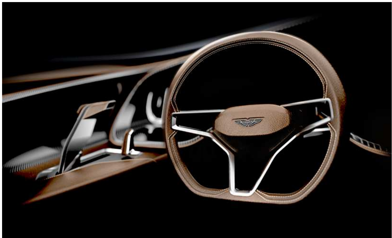
快艇驾驶舱的方向盘设计制作也十分精致，并且有阿斯顿马丁的品牌标识

“自从许可协议签署之后，阿斯顿马丁设计部门的工作人员已经与quintessence公司的研发单位以及著名船舶工程师进行了一系列的洽谈，并立刻在阿姆斯特丹展开了项目的设计与制作。”