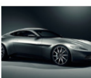
ASTON MARTIN DÉVOILE SON NOUVEAU MODÈLE SPÉCIAL JAMES BOND